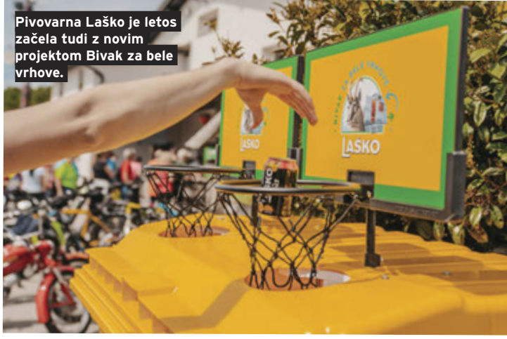
Pivovarna Laško je letos začela tudi z novim projektom Bivak za bele vrhove.