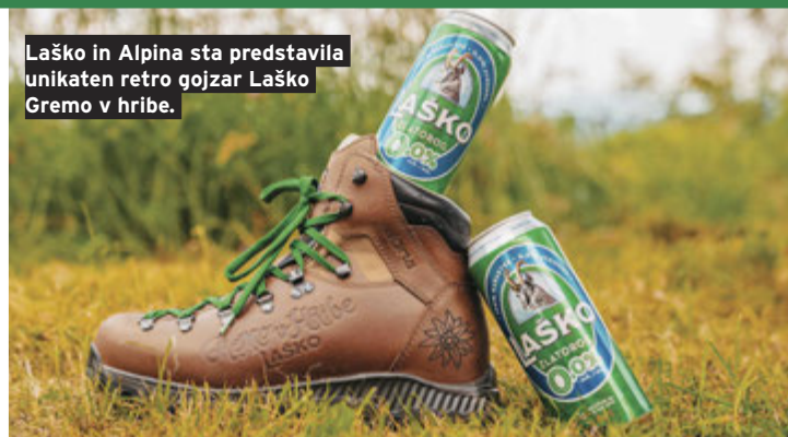
Laško in Alpina sta predstavila unikaten retro gozdar Laško Gremo v hribe.